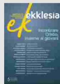
INCONTRARE CRISTO, INSIEME AI GIOVANI